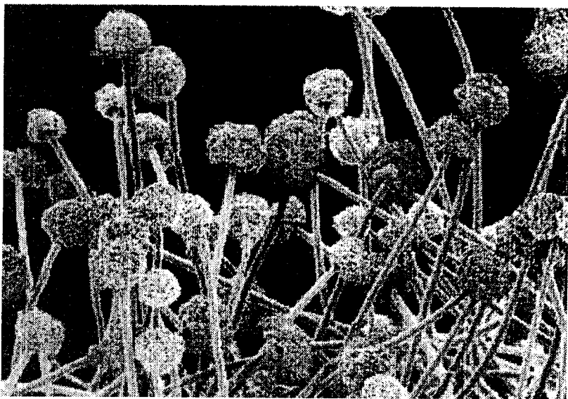
Fig.2: Fotografia ottenuta al microscopio elettronico a scansione di materiale fungino, è visibile in cima agli steli il contenitore delle spore.

Va detto in primo luogo che l'esina, pur essendo molto resistente alla degradazione, ovviamente non è indistruttibile, quindi è normale assistere ad una progressiva riduzione del polline spo-