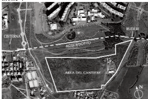
Area dei lavori vista dall'alto

L'inizio della vicenda reca una data precisa: il 13 dicembre 2005. È in questo giorno, infatti, che il Consiglio Comunale riunitosi in seduta pubblica vara la delibera n. 318 con cui, tramite un "Programma di Trasformazione Urbanistica", concede il nulla osta alla compensazione edificatoria, attraverso la rilocalizzazione delle volumetrie nelle aree di "Tor Tre Teste", dell'ex comprensorio E1 (espansione con Piani comprensoriali unitari) denominato "Monti della Caccia" (ricompreso nel Parco di Decima-Malafede), la cui destinazione originaria viene modificata a sottozona H2 (agro romano vincolato). Le aree situate in località "Tor Tre Teste", dove avverrà la cementificazione, subiscono le varianti di PRG da sottozona M2 (attrezzature di servizi privati) e in minima parte zona N (parchi pubblici e impianti sportivi) a "zona in corso di convenzione".