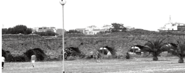
Dalla "Cronaca di Roma" di alcuni quotidiani

Non si può dimenticare che questa piacevole zona incastonata tra le vie Casilina e Prenestina ha già pagato nei decenni scorsi un pesante tributo a una barbara edificazione: per la realizzazione di capannoni industriali prima (anni '50-'60) e di quartieri residenziali poi ('70). Particolarmente grave e triste fu la sorte di ciò che si trovava lungo la Prenestina tra l'8° e l'11° Km: «... i ritrovamenti sono collegati alla selvaggia Arcate dell'acqua alessandrina