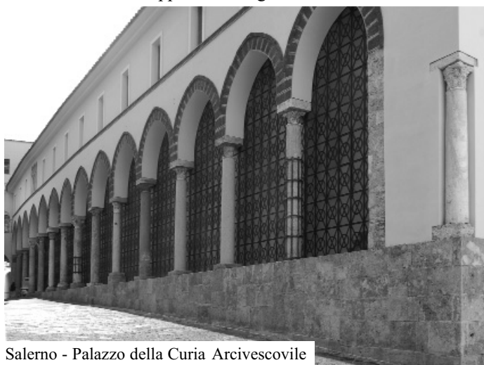
Salerno - Palazzo della Curia Arcivescovile