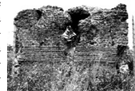
Antica cisterna romana

L'intera zona è ricca di testimonianze storiche e numerosi avanzi fanno sfoggio di sé sparsi tra case, prati e ancora nello stesso Parco, dove è presente addossata proprio all'acquedotto e in uno stato di totale abbandono una cisterna rettangolare di raccolta delle acque pluviali, "riconvertita" a giaciglio notturno, le cui pareti presentano evidenti tracce di cocciopesto, cioè calce mescolata a frammenti di terracotta (ad esempio tegole frantumate) utilizzata dai Romani come impermeabilizzante, quindi a rivestimento di fondo e pareti di vasche in muratura o, appunto, di cisterne o nei pavimenti (si pensi all'utilizzo negli ambienti termali). La cisterna, e questa è la cosa più interessante, è di epoca precedente all'acquedotto e probabilmente faceva parte di una villa; la muratura, difatti, è realizzata con la tecnica dell'opus mixtum, paramento costituito da tufacci cubilia