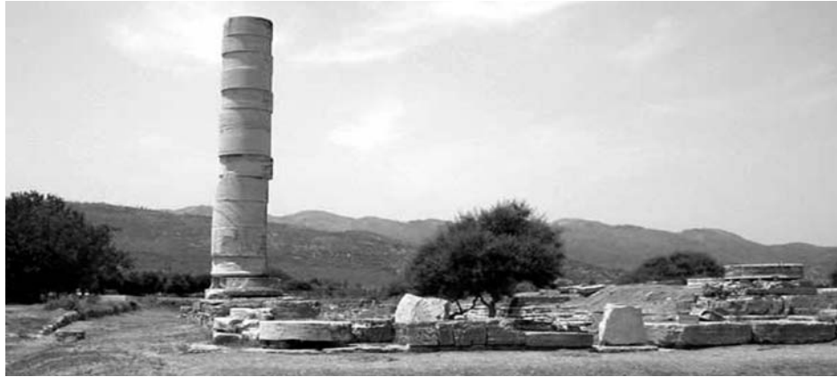
L'Heraion di Samo

La fama archeologica di Samo è legata soprattutto ai resti del celebre santuario di Hera, sorto fra il IX e l'VIII sec. a.C. nei pressi di un modesto corso d'acqua, l' Imbrasos : qui erano un altare, tempietti e un tempio lungo cento piedi con l'ingresso orientato a est e una lunghissima cella in due navate. Nei pressi era un bacino sacro per i bagni rituali dell'antico simulacro ligneo della dea. La sistemazione del santuario conobbe un momento decisivo intorno al 560 a.C. allorché agli architetti locali, Rhoikos e Theodoros , venne affidato il compito di erigere un nuovo colossale tempio della dea, modificandone l'orientamento e ponendolo in asse con un altrettanto grandioso altare, all'interno di un complesso di edifici di servizio e di prestigiose opere d'arte. Il tempio (di ben 105 x 52,50 m) era circon-