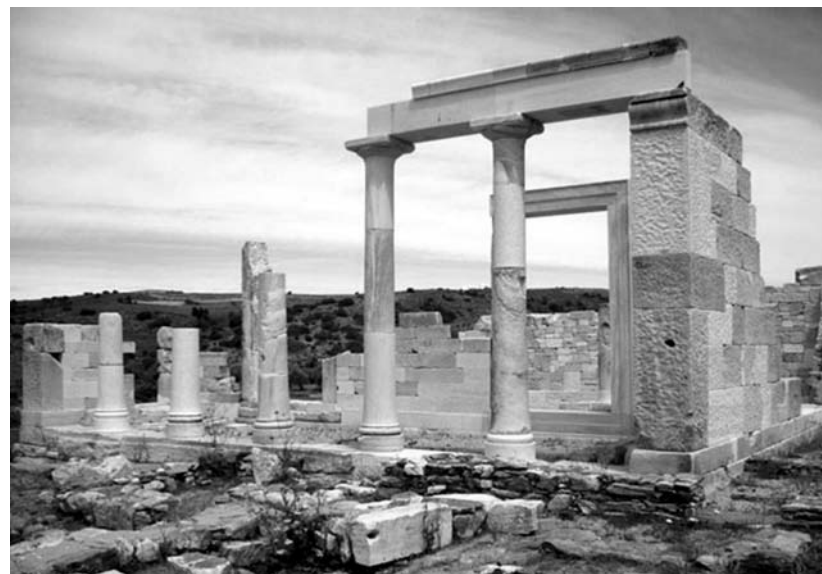
Nasso, Tempio di Apollo

Tra la seconda metà del IV e gli inizi del II sec. a.C., dopo un incendio che ne devastò le strutture, una serie di interventi di sistemazione globale dell'area introdusse quelle scenografiche associazioni di scalinate e colonnati che caratterizzarono l'architettura ellenistica, e soprattutto quella di tradizione microasiatica. Il tempio fu elaborato nelle