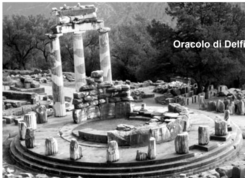
Oracolo di Delfi

Sulla destra poi, il teatro, in eccellenti condizioni di conservazione, conclude la prospettiva del complesso santuario apollonico in posizione eccentrica, addossato al pendio secondo la consuetudine greca: a esso si giungeva sfilando tra eleganti portici affrescati, esedre adorne di sculture e donari rilucenti di bronzo. Al di fuori del temenos era infine lo stadio, parzialmente scavato nel pendio, lungo circa 180 metri e circondato da gradinate su un alto podio: qui si disputavano le