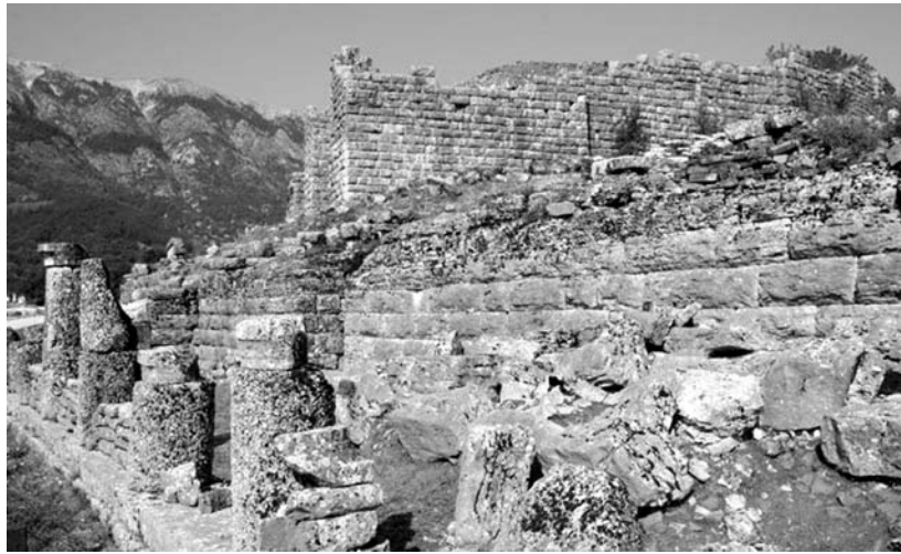
Resti del santuario di Dodona

Il sito archeologico 4 , vastissimo, è composto da quattro zone distinte: il santuario, la città con i quartieri residenziali e commerciali, la terrazza dei templi dedicati alle divinità straniere e il centro sportivo (ginnasio, palestra, stadio). Dal porto antico (risalente all'VIII secolo a.C.) si supera un'Agorà tardo ellenistica ro-