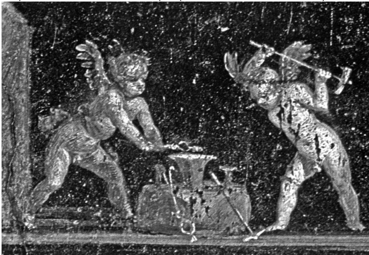
Riproduzioni di particolari da un quadro nella "casa dei Vettii" a Pompei: Putti intenti alla monetazione

paea si stabiliva che, dopo la formazione del testamento, in caso di morte dell'erede o del legatario, se il testatore era ancora in vita o comunque prima dell'apertura del testamento la parte di eredità che sarebbe andata all'erede morto veniva incamerata dallo Stato. Ugual sorte se l'erede o il legatario fosse considerato persona indegna o avesse perso i diritti civili. Stabiliva inoltre che, se un celibe avesse ricevuto da un testamento beni di valore superiore a quanto stabilito dalla legge, la parte eccedente sarebbe stata devoluta alle casse pubbliche.