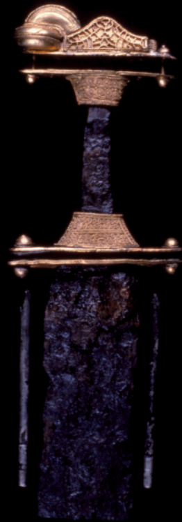
Spada in ferro con impugnatura in oro - Tomba L. Nocera Umbra, inv. 36 (3) - Roma - Museo dell'Alto Medioevo

Si potrà anche visitare il MUSEO ARCHEOLOGICO, dopo il riadattamento dell'area longobarda con un nuovo impianto multimediale, volto a valorizzare la ricchezza dei corredi venuti alla luce nelle necropoli sul nostro territorio. La tecnologia nel museo è una opportunità per valorizzare i contenuti, le storie e migliorare l'interattività, recuperare molti straordinari manufatti che pur appartenenti alle nostre