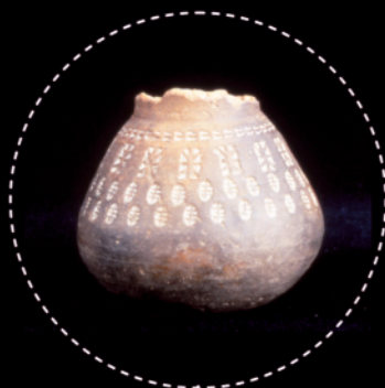
Ceramiche stampigliate, T. 148 Necropoli Nocera Umbra Invv. 1101 Roma Museo dell'Alto Medioevo