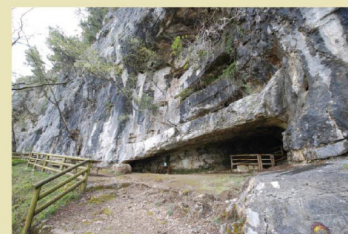
Libeti (CE), frazione Profeti. Ingresso della grotta di San Michele Arcangelo in Monte Melanico.