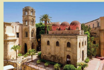
Palermo, Chiesa di San Cataldo.