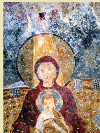
Montecorvino (SA), Chiesa di Sant'Ambrogio, Theotokos, Madonna in sedis

SABATO 4 NOVEMBRE 2023 - h. 9.30/13.30 - Basilica Paleocristiana – PAESTUM – XXV BMTA