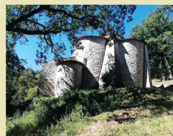
Castelgrande (PZ), Santa Maria di Costantinopoli. Finestrlla Gnomonica - abside esterno sinistro